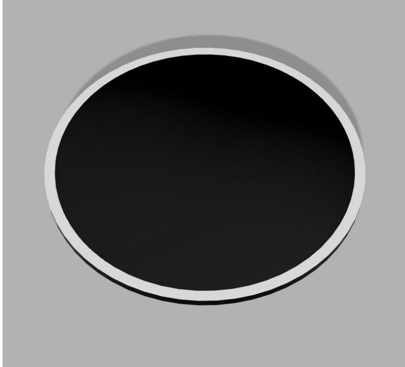
Şekil 2: Mini Sumo Yarışma Alanı (Dohyo)